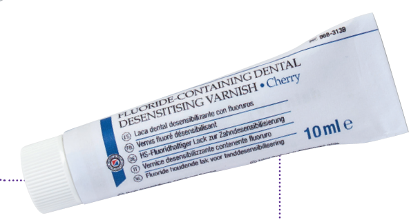
HS-Fluoridhaltiger Lack für Kinder

TIPP unter 18 Jahren wird die PZR bei Kindern von den Krankenkassen übernommen