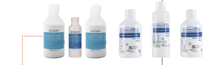
B.A. & HS-Acclean Prophylaxe-Pulver