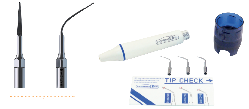
B.A. ZEG Spitzen